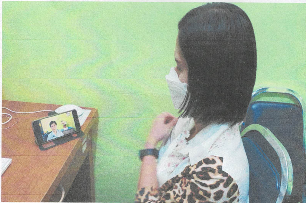
๗ มีนาคม ๒๕๖๕ เวลา ๑๔.๐๐ น. โรงพยาบาลตากฟ้า