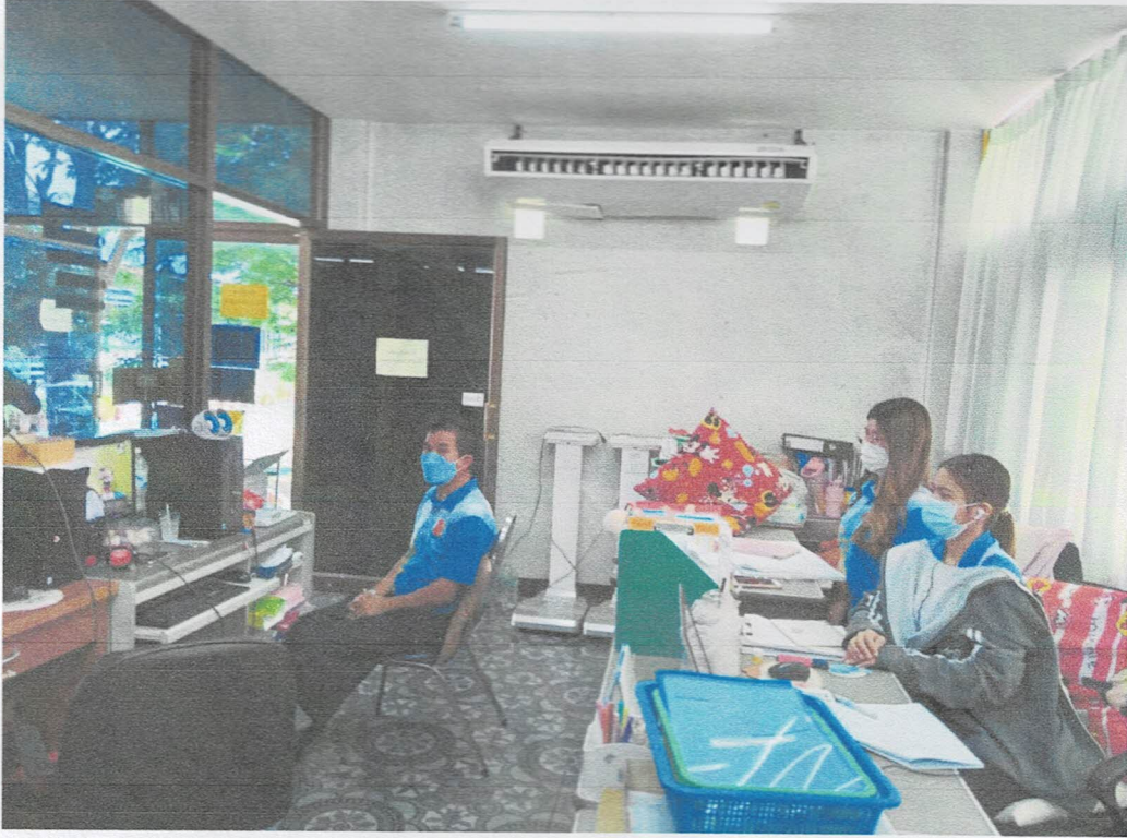
๗ มีนาคม ๒๕๖๕ เวลา ๑๔.๐๐ น. โรงพยาบาลตากฟ้า

อบรมความรู้แก่เจ้าหน้าที่ในหน่วยงานเกี่ยวกับการเสริมสร้างและพัฒนาทางด้านจริยธรรม และการมีวินัยรวมทั้งการป้องกันมิให้กระทำผิดวินัย ในรูปแบบ (On air)