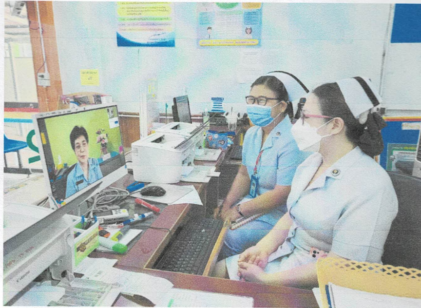
๗ มีนาคม ๒๕๖๕ เวลา ๑๔.๐๐ น. โรงพยาบาลตากฟ้า