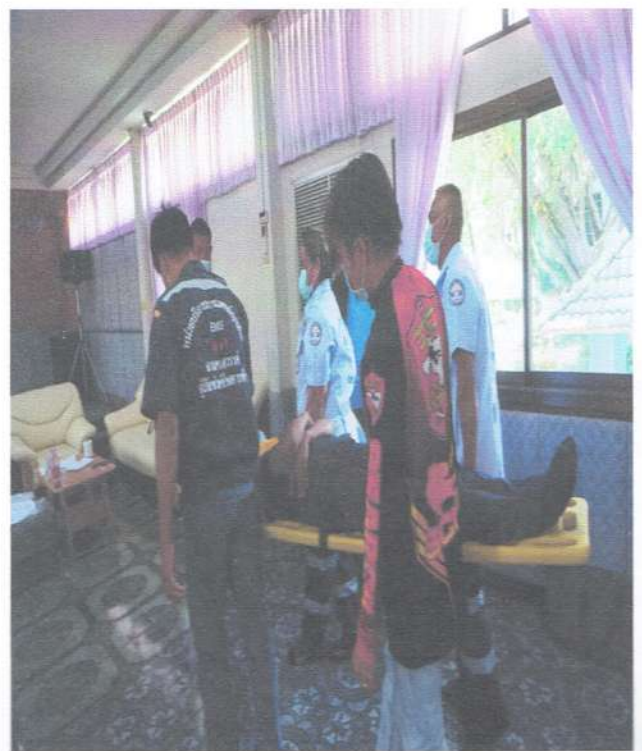
รูปภาพภาคบ่าย การยกและการเคลื่อนย้ายผู้บาดเจ็บ