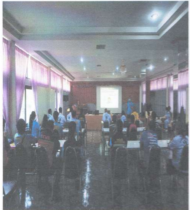
รูปภาพบรรยายภาคเช้า การวัดสัญญาณชีพ/การใช้ยาเบื้องต้น/การประเมินสถานการณ์ /การประเมินผู้ป่วยเบื้องต้น