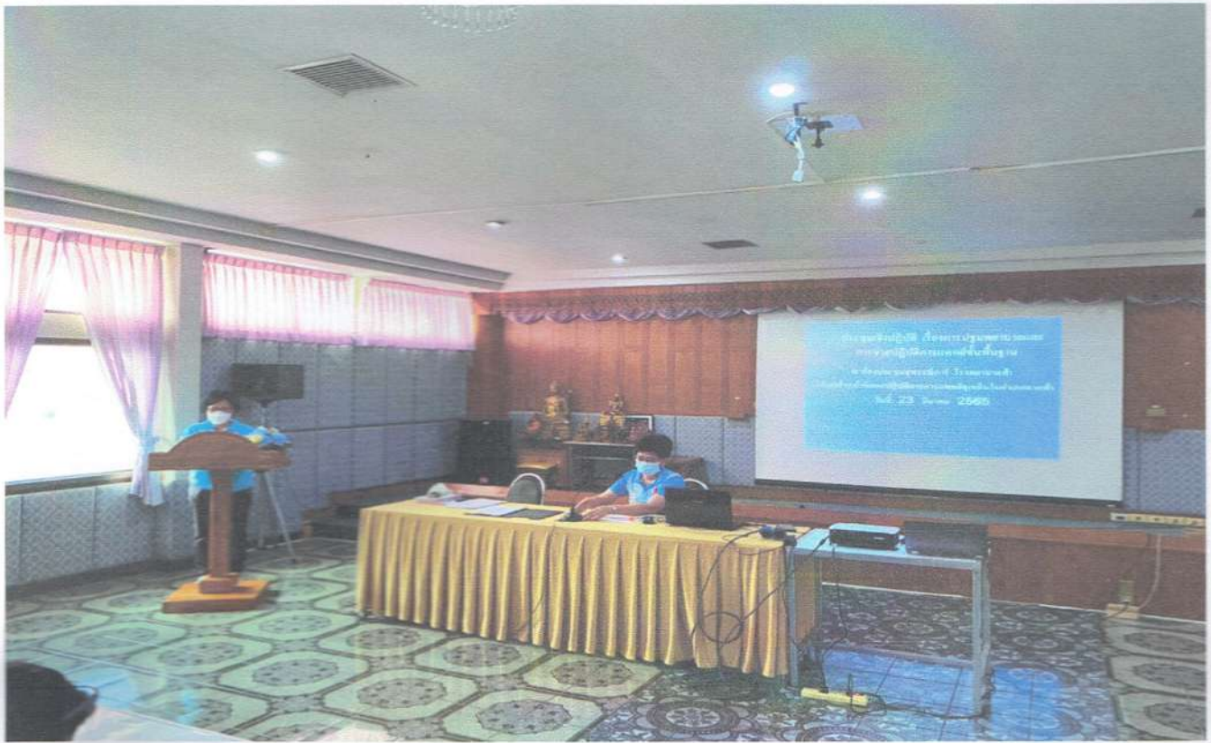
หัวหน้าพยาบาลเป็นประธานเปิดการอบรมแทนผู้อำนวยการโรงพยาบาลตากฟ้า