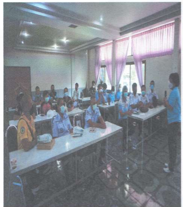
รูปภาพบรรยายวิชาการภาพเข้า ระบบบริการการแพทย์ฉุกเฉิน / กฎหมายและจรรยาบรรณ วิชาชีพ/ภาวะฉุกเฉินทางการแพทย์และการดูแลผู้ป่วยฉุกเฉิน