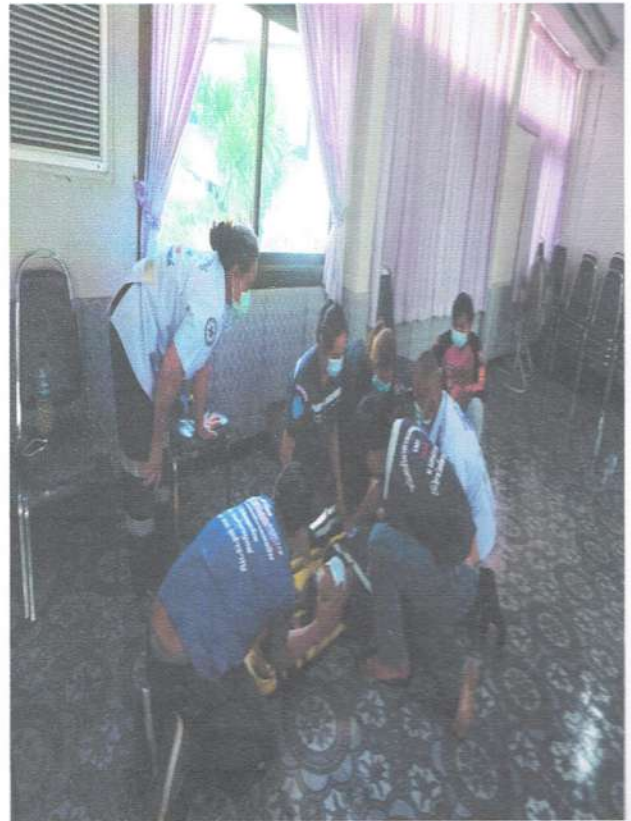
รูปภาพการยกและการเคลื่อนย้ายผู้บาดเจ็บ