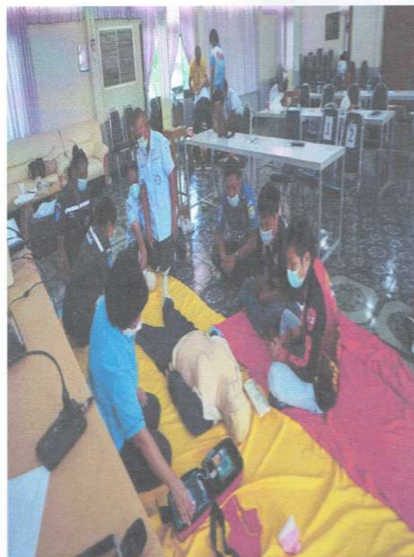
รูปภาพฝึกปฏิบัติการภาคบ่ายการช่วยฟื้นคืนชีพและการใช้เครื่องAED