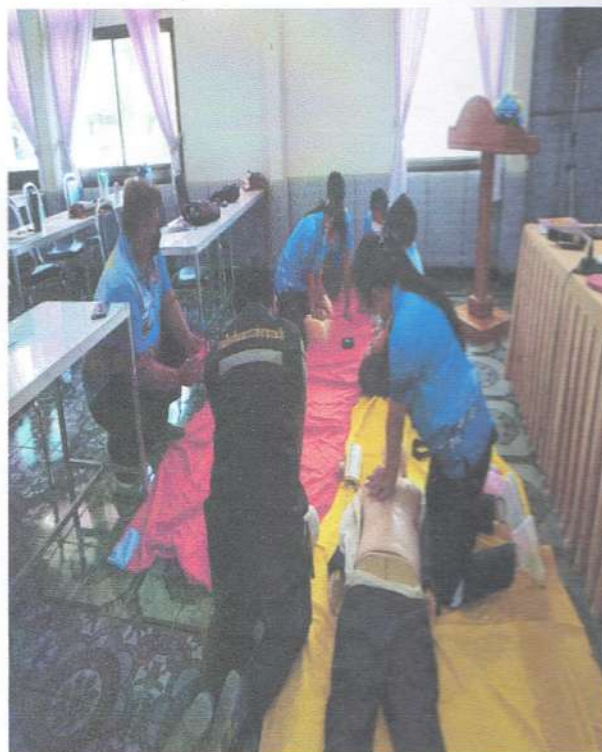
รูปภาพฝึกปฏิบัติการภาคบ่ายการช่วยฟื้นคืนชีพและการใช้เครื่องAED