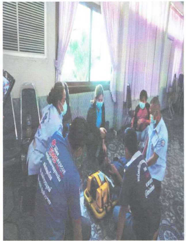
รูปภาพภาคบ่าย การยกและการเคลื่อนย้ายผู้บาดเจ็บ