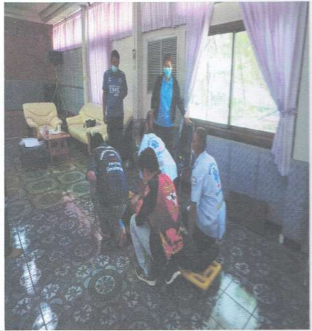
รูปภาพภาคบ่าย การยกและการเคลื่อนย้ายผู้บาดเจ็บ