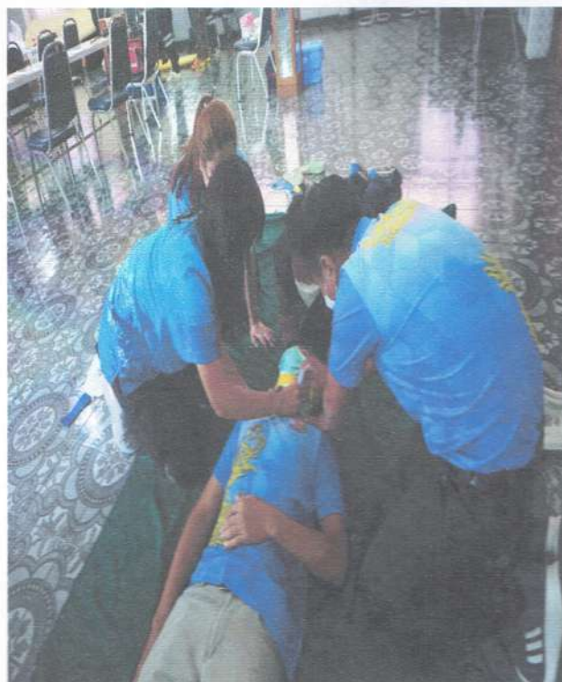
รูปภาพการใส่Hard Collar ทำนอน