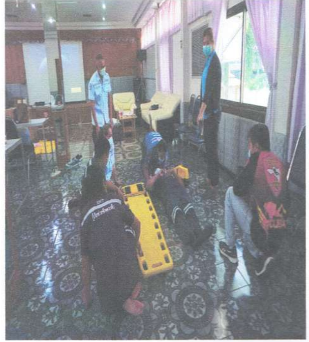
รูปภาพการยกและการเคลื่อนย้ายผู้บาดเจ็บ