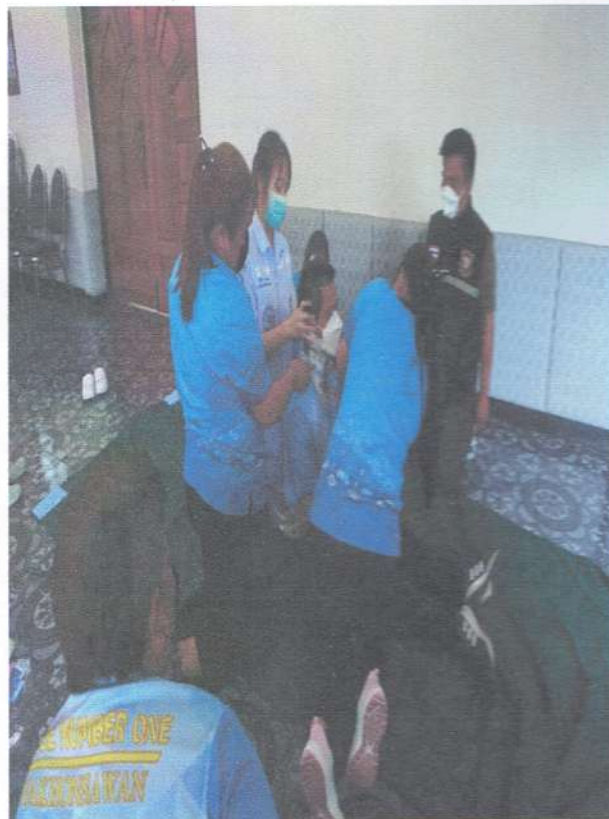
รูปภาพการใส่Hard Collar ทำนั้ง